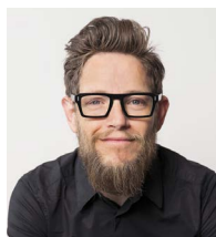
Tobias Eisenbraun SpOrt concept GmbH