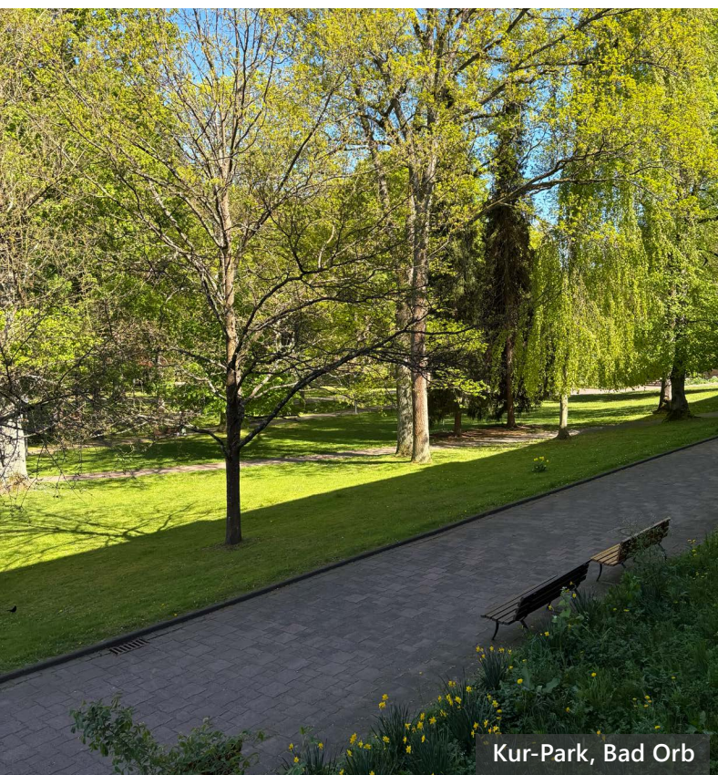
Kur-Park, Bad Orb

Sobald die Punkteanzahl feststeht, werden wir Sie hierüber informieren.