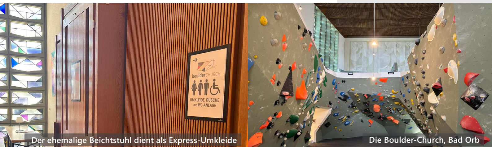
Der ehemalige Beichtstuhl dient als Express-Umkleide

Restaurant Kurpark Horststraße 63619 Bad Orb