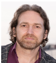
Kai Landwehr Stiftung myclimate