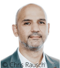
Antonino Vultaggio HPP Architekten, Düsseldorf