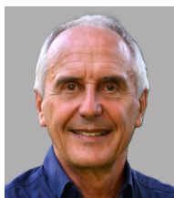
Thomas Wilken Kontor 21