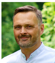
Klaus Tenhofen Planungsbüro DTP Landschaftsarchitek- ten GmbH