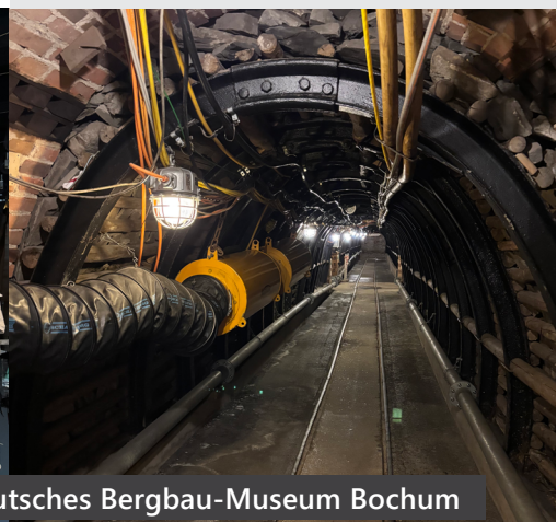
Deutsches Bergbau-Museum Bochum