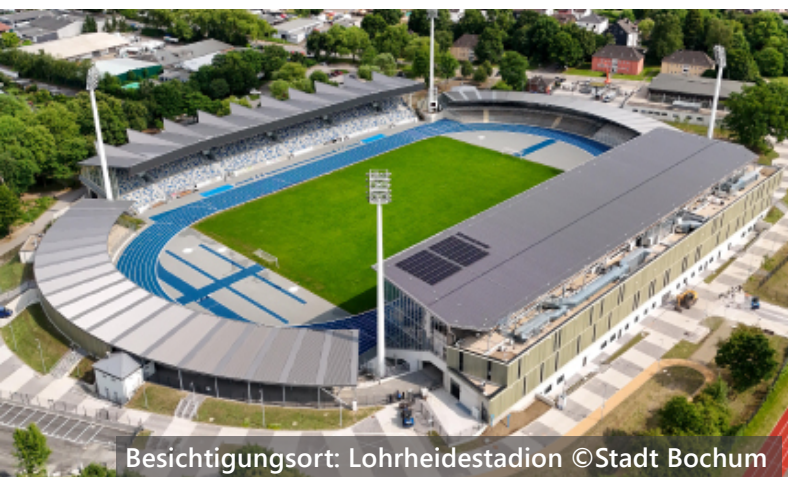
Besichtigungsort: Lohrheidestadion

Deutsches Bergbau-Museum Bochum Am Bergbaumuseum 28 44791 Bochum