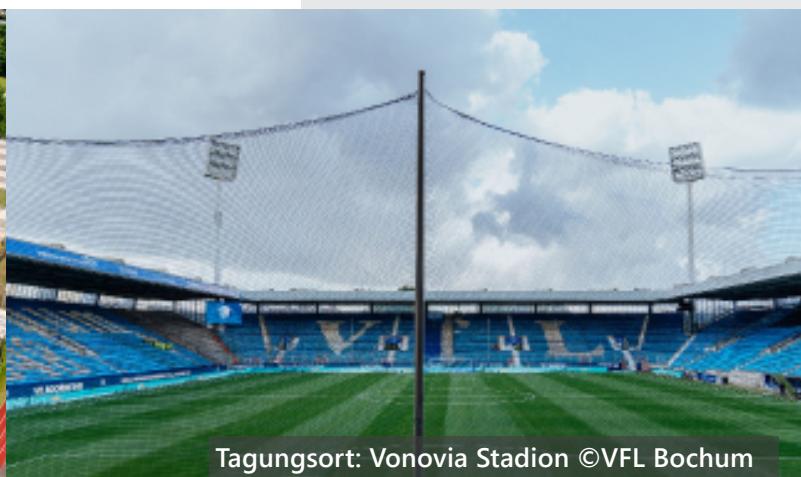
Tagungsort: Vonovia Stadion