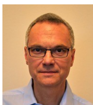
Peter Reuff Planungsbüros PETER REUFF LICHT